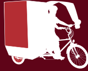
velopub - Style Rétro

Contactez-nous pour connaître nos tarifs, ou consultez notre site Internet