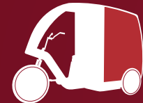
velopub - design futuriste